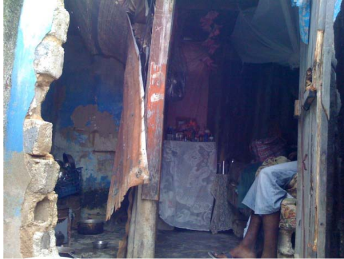
Façade principale de la maison où vit la mère de Raymonde LAMARRE