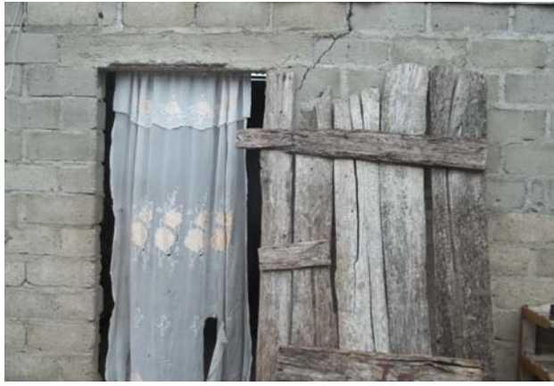
Porte d'entrée de la maison où vivent les enfants de la détenue